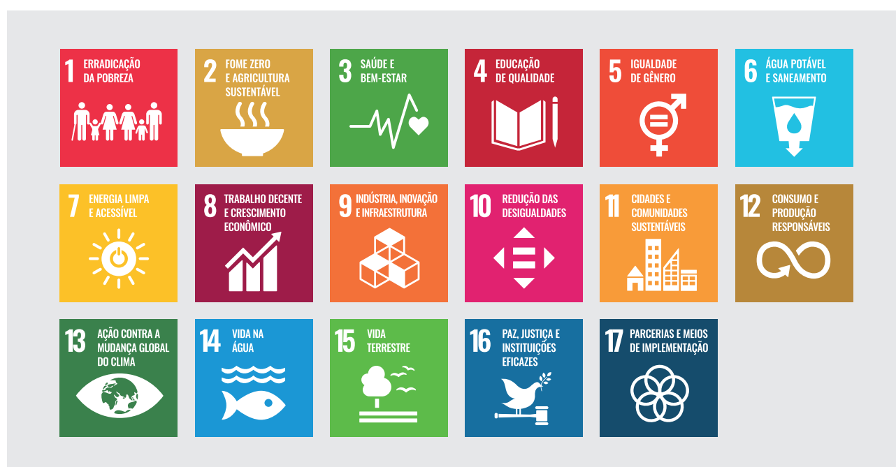
FIGURA 2 | Objetivos de Desenvolvimento Sustentável

Em 2015, mesmo ano em que a ONU estabelece a agenda 2030 para o desenvolvimento sustentável, com objetivos e metas a serem cumpridas em 15 anos em prol da erradicação da pobreza e da promoção de vida digna para todos, surge a rede global de bancos de leite humano (rBLH). O documento a oficializar a criação estabelece novo marco de atuação para os BLHs, direcionando-os para os compromissos estabelecidos na agenda 2030 para o desenvolvimento sustentável na área da saúde. Decide-se centrar esforços com vistas a assegurar uma vida saudável e promover o bem-estar para todos, de todas as idades (ODS 3) e fortalecer os meios de implementação da parceria global para o desenvolvimento sustentável (ODS 17).